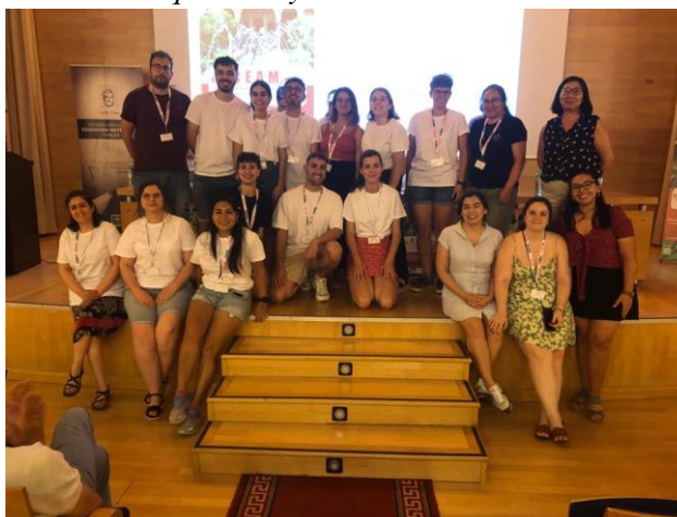
Figura 12. Voluntarios Reconocimiento a los voluntarios que nos ayudaron estos 3 días

Desde la delegación y el comité local se ha hecho una gran apuesta en este CEAM por el futuro de la asociación THALES y los profesores y profesoras que están por llegar. Más de 20 voluntarios de diferentes grados y másteres han trabajado porque todo fuese sobre ruedas.