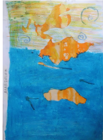
Figura 7. Atardecer.