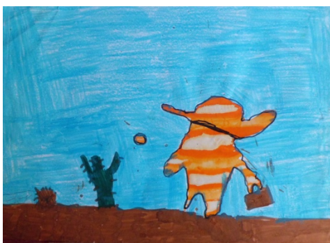
Figura 4. Vaquero.

De esta actividad, cuyo objetivo era el de trabajar el concepto de azar a través del arte, destaca la gran creatividad de los niños. Ellos debían observar la forma de la mancha que les había salido al azar e imaginar con qué podía corresponderse dicha forma. Un vaquero (Figura 4), un tapir (Figura 5), una fresa (Figura 6) y un atardecer (Figura 7) son algunos de los ejemplos.