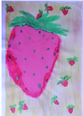
Figura 6. Fresa.