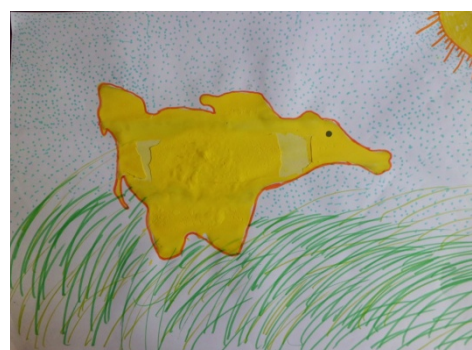
Figura 5. Tapir.