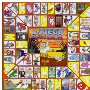
Figura 2. Tablero del juego de La oca .