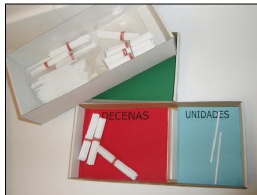
Figura 3. Caja CDU

El trabajo con la caja facilita al máximo la exploración y la manipulación de los números, ofrece un primer modelo básico para que los niños y niñas comprendan el modo en que se organizan y distribuyen las cantidades según la estructura del Sistema Numérico Decimal. Este recurso puede ser un modelo previo antes de incorporar otros más abstractos como el ábaco o los bloques multibase.