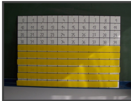
Figura 2. Panel numérico

El panel presenta los números del cero al noventa y nueve por familias, lo que permite nuevas posibilidades de análisis y de relación. Es especialmente útil para descubrir regularidades, analizar y describir la relación entre los números que pertenecen a la misma fila o a la misma columna.