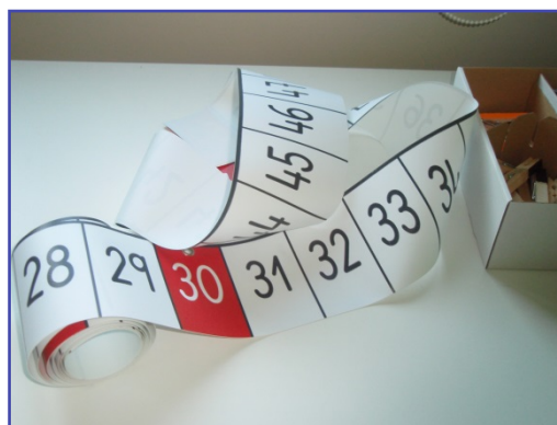
Figura 1. Cinta numérica

Este recurso facilita la apropiación de los números del cero al cien como una secuencia linealmente ordenada, proporciona un soporte constante para conectar el nombre de los números con su representación simbólica, enriquece el contexto de aprendizaje a través de la información que nos da cada número sobre sí mismo y en relación con los demás, permite visualizar el efecto de las operaciones sobre los números, favorece la adquisición de estrategias para el cálculo mental.