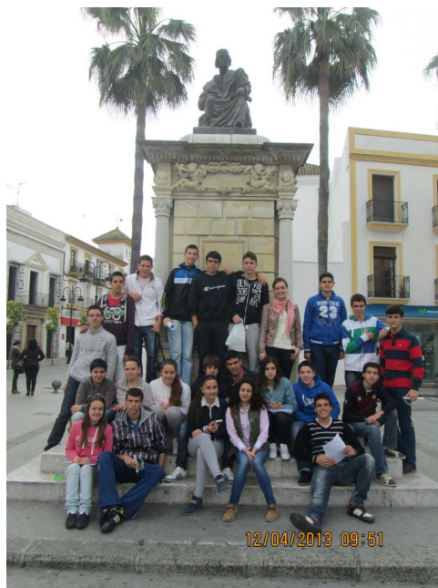
Figura 1. Fotografía del grupo durante la actividad.

Esta propuesta innovadora ha consistido, por tanto, en una serie de actividades programadas por competencias básicas de forma integrada, en las que se otorgaba una especial relevancia a la investigación, capacidad crítica, trabajo colaborativo, etc., además de a las habilidades, actitudes y valores, relacionados con aspectos tanto intra como interpersonales, y a las estrategias de aprendizaje. Todo ello con el fin de desarrollar las competencias básicas desde una visión relacional y acercar a los alumnos a la resolución de problemas y tareas en el mundo real.