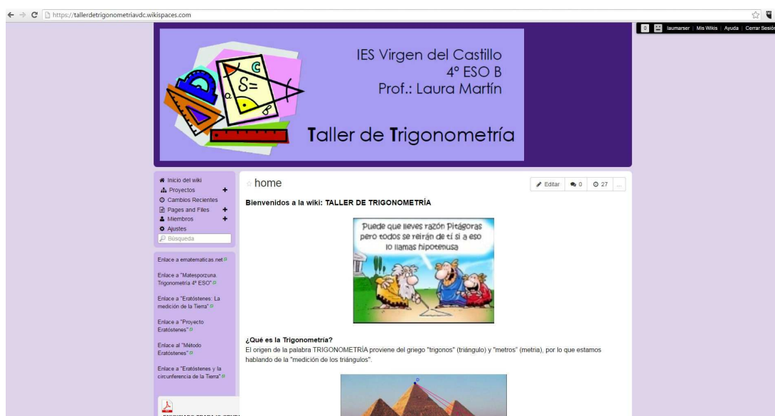
Figura 3. Pantalla de inicio de la Wiki tallerdetrigonometriavdc .

Se usó también un carro de ordenadores, para que los alumnos buscasen información en internet por grupos y usasen la wiki antes mencionada, en la que además de buscar información sobre trigonometría y sus aplicaciones, y disponer de enlaces a vídeos de interés, tuviesen también un espacio destinado a que cada grupo subiese su trabajo, quedando así compartida la información.