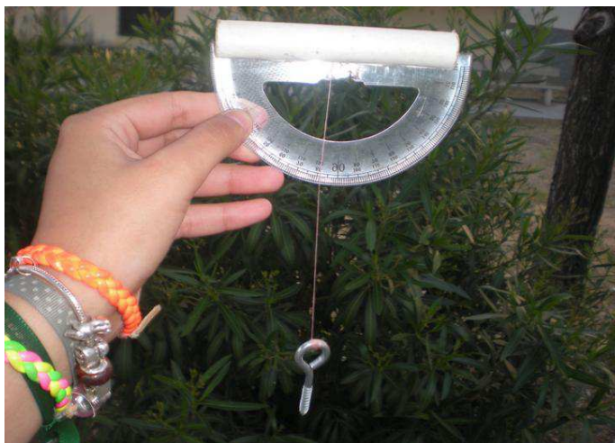
Figura 4. Usando el teodolito en la calle.

Se procuró que llevasen todo bastante claro para que no se perdiera el tiempo y pudieran tomar la totalidad de las medidas durante la hora de salida (a los que no les dio tiempo, tuvieron que terminar la recogida de datos en horario no lectivo). Para esta actividad los alumnos no podían olvidar llevar su teodolito casero, cinta métrica, cámara de fotos, cuaderno y útiles de escritura (Figura 4).