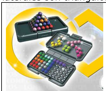
Figura 1: Puzzler

El Puzzler (Fig. 1) está formado por una base rectangular y 12 piezas que son algunos triminós, tetraminós y pentaminos, todos ellos formados por esferas unidas alineadas o en ángulos rectos. Con las piezas se puede rellenar de diversas formas el rectángulo base, pero también se pueden formar pirámides de base cuadrada y cuyas caras laterales son triángulos rectángulos e isósceles.