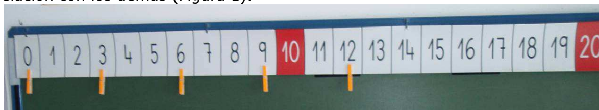
Figura 1. Cinta numérica

En la cinta, el aprendizaje de cada número no se realiza de manera aislada, sino como parte de secuencias más amplias. Esto enriquece el contexto de aprendizaje ya que cada número aporta información sobre sí mismo pero en relación con los demás (Figura 1).