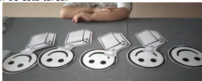
Figura 2. Relación entre niños y zumos ( f(n)=n-1 ).

Paco va a celebrar su cumpleaños y necesita comprar lo necesario para los asistentes a la fiesta. Los elementos con los que se puede interactuar son diversos, gorros, piruletas, globos... etc. En la figura 2 detallamos un ejemplo de la implementación de esta tarea.