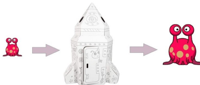
Figura 1. Cambio cualitativo que produce el cohete mágico.

A clase llega un cohete mágico tripulado por Sofía, el cohete genera cambios cualitativos y cuantitativos en las "cosas" que se introducen en él. En la figura 1, se puede apreciar el cambio de tamaño que experimentó el extraterrestre al meterse dentro del cohete.